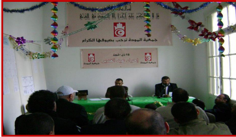
احتفال بعيد الغدير