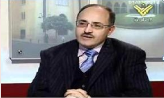
غسان بن جدو