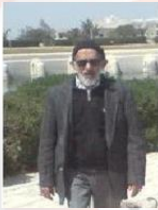
الشيخ بيوض شيخ الشيعة بطبلبة