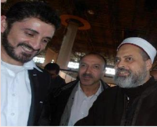
متخرج من المشاركين في العديد من المؤتمرات الشيعة بكل من سوريا وإيران