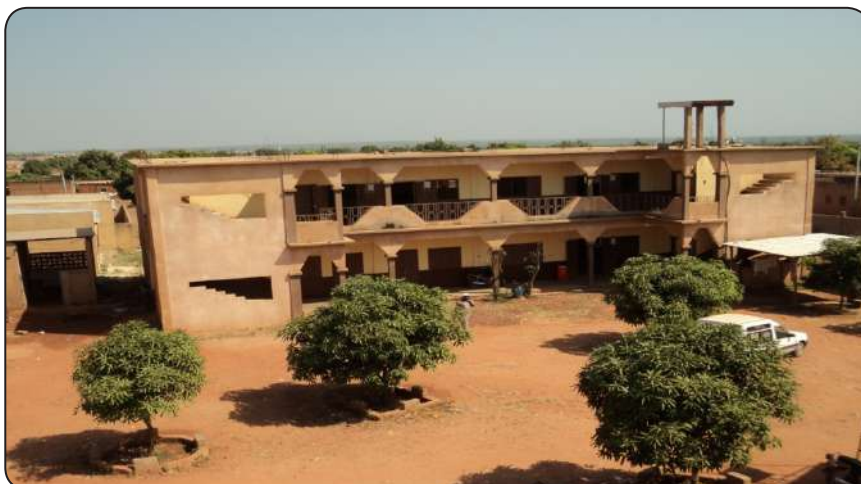
مبنى كلية الفرقان بمدينة بوبو جولاو