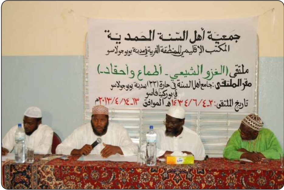
جانب من المحاضرين