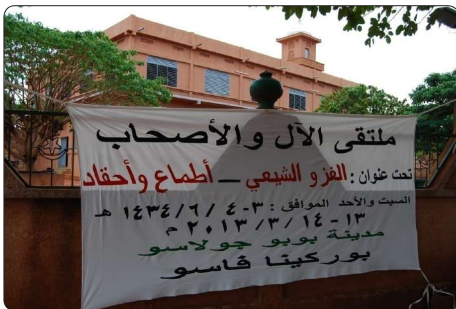
صورة مقر إقامة ملتقى الآل والأصحاب بمدينة بوبو جولا سو