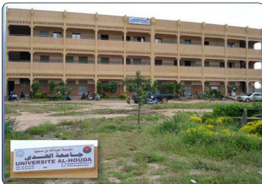
مبنى جامعة الهدى بالعاصمة واغادوغو