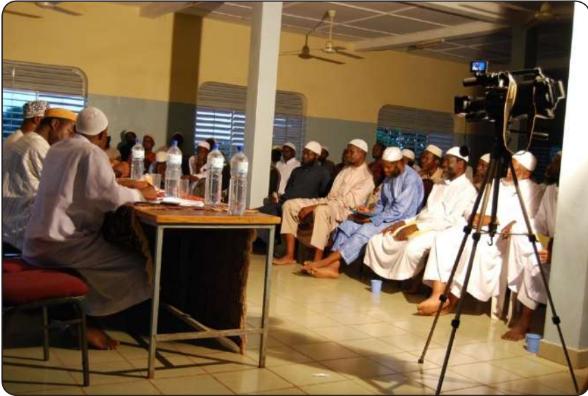
صورة المشاركين في ملتقى الآل والأصحاب بمدينة بوبو جولا سوبو