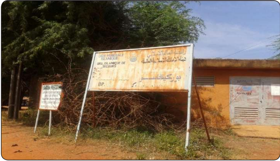
لوحة إخبارية لمستوصف هيئة الإغاثة الإسلامية العالمية تابع لرابطة العالم الإسلامي بمدينة بوبو جولاو