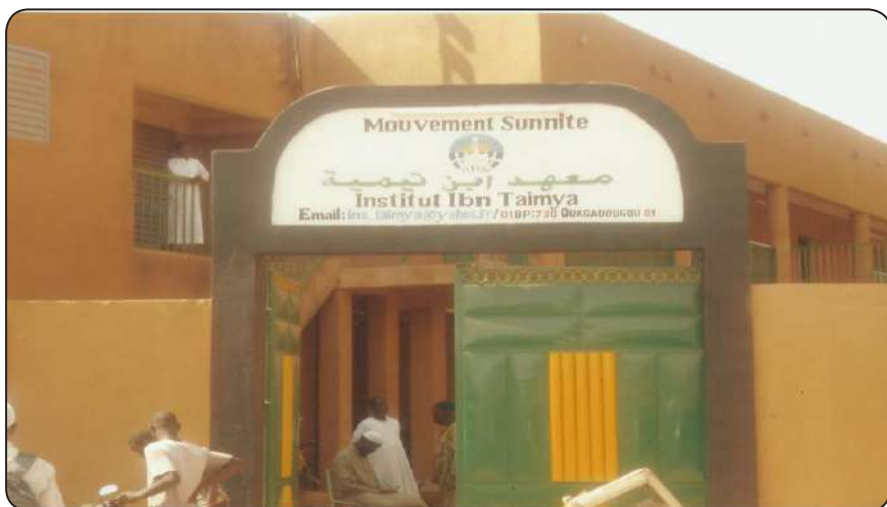
مدخل معهد ابن تيمية بالعاصمة واغادوغو