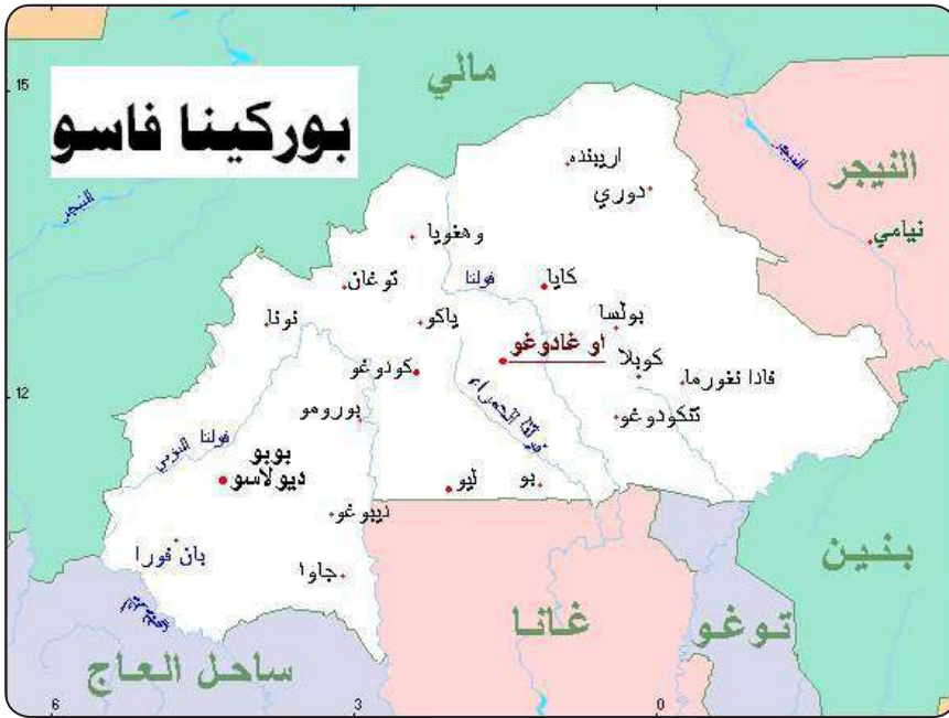
خريطة بوركينا فاسو بالعربية