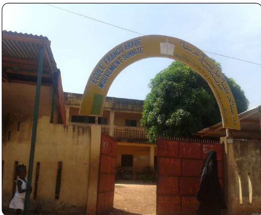
مدخل مدرسة جمعية أهل السنة بمدينة بوبو جولاو