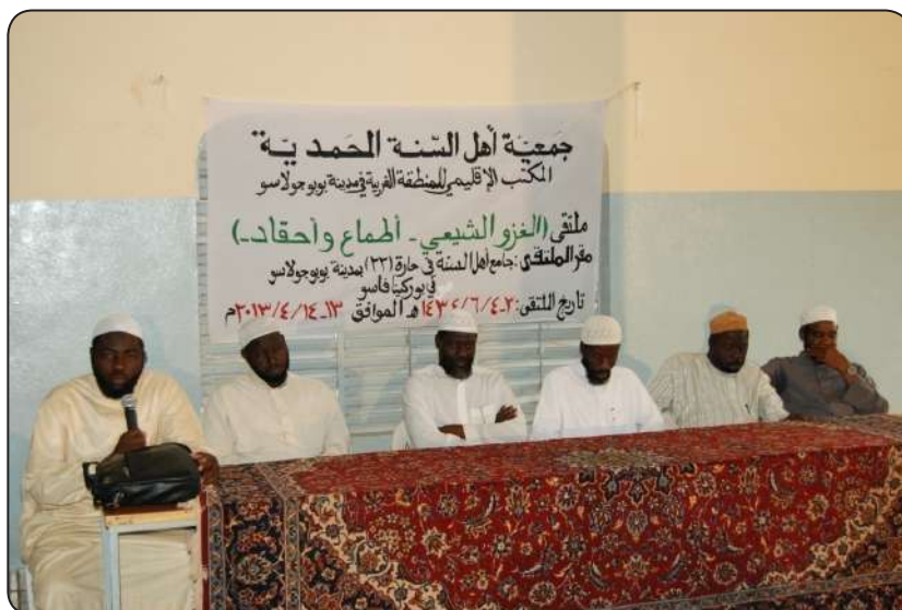
إحدى جلسات ملتقى الآل والأصحاب الثالث