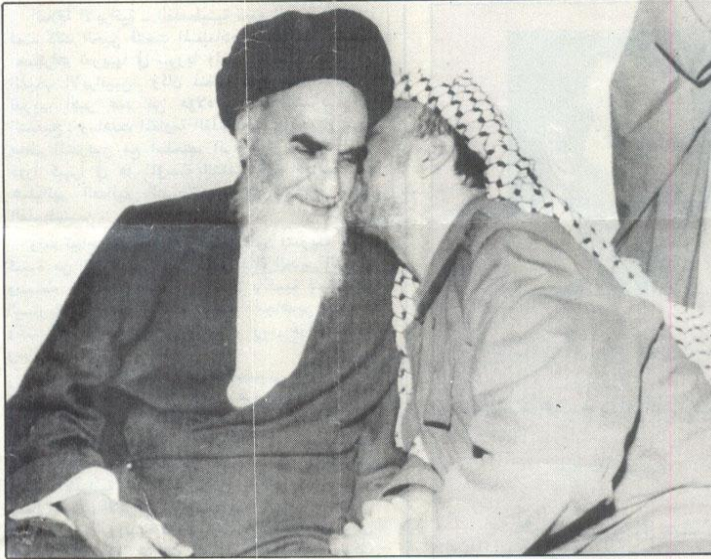
خميني - عرفات